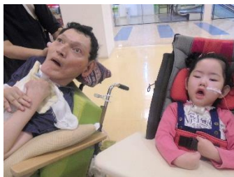
海鳴楼（オルゴール製作）